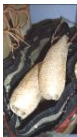
Lufa « Lilemwa gnuoku », «Nez de l'éléphant», culture.