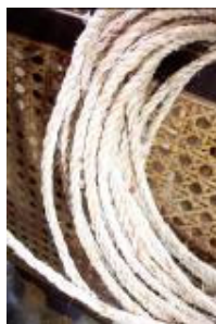
Corde « Lokosa », Liane, collecté