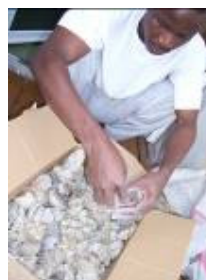
Encens deux variations, « Elemi », « Itsua »/Copal, collecté.