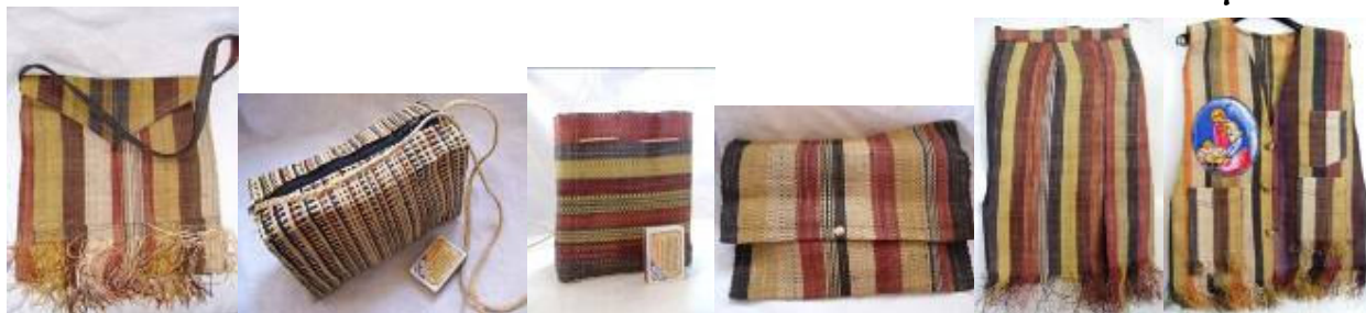
Raphia avec couleurs naturels:sacoche,porte-documents,jupe,gilet,tapis photo,portemonnaie,plumier.