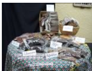
Epices (piper nigrum/«ketsu» collecté; piment/ «pili-pili»- fumé, séché, différents variations, culture familiale ; laurier - collecté; soja - cultivé ; haricots mini brun / « kunde » - cultivé, café culture familiale; champignons séchés - collecté.